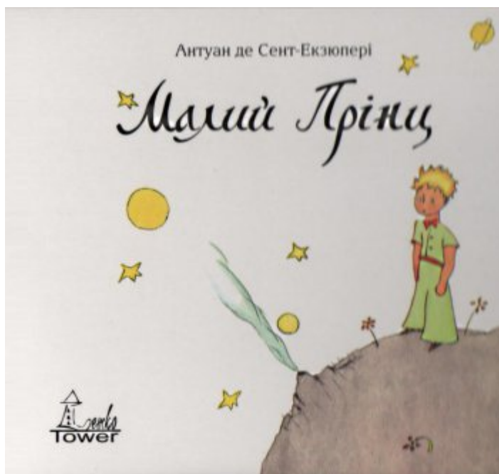
Mały Książę - okładka

łemkowski, pomysłodawca i redaktor serii wydawniczej Golem.